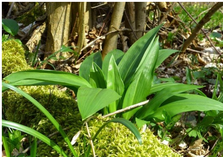
Bršlice kozí noha 7